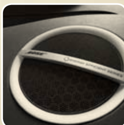
AUDIO SUSTAV BOSE®